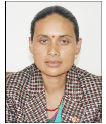
निमकुमारी बि.क. वडा सदस्य