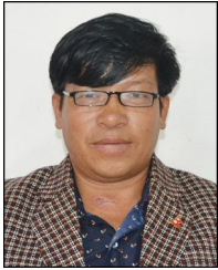
मिम ब. घर्तीमगर वडा अध्यक्ष