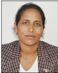
तिलमती बि.क. वडा सदस्य