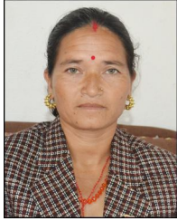
बेलमती नेपाली वडा सदस्य