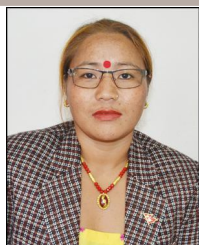
सती घर्ती वडा सदस्य