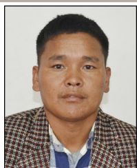
विर्स ब. घर्तीमगर वडा सदस्य