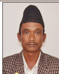
मुक्त ब. शाही ठकुरी वडा सदस्य