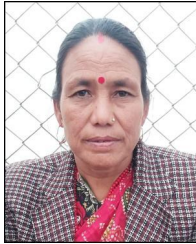
चुकैनी बि.क. वडा सदस्य