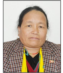
धनमाया पुन वडा सदस्य