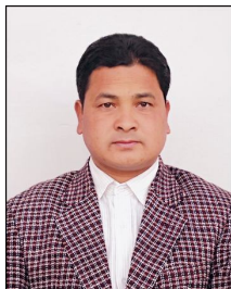
पूर्ण के.सी. नगर प्रमुख