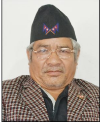
सनसिं बुढामगर वडा अध्यक्ष