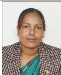
गायत्री बि.क. वडा सदस्य