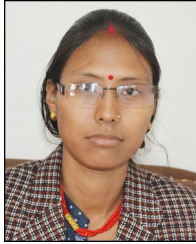
टीका पुन वडा सदस्य