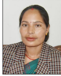
दिलमाया बि.क. वडा सदस्य