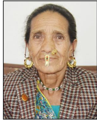
धनसरी सुनार वडा सदस्य