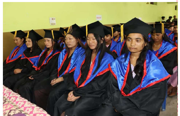
रोल्पा नगरपालिकाले आयोजनागरेको दिक्षात्म समारोह

गरिएको छ । त्यसैगरी शैक्षिक वर्ष कै शुरुवातमा ६६ सामुदायिक विद्यालयमा पाठ्य पुस्तक उपलब्ध गराएर बाल बालिकालाई पाठ्य पुस्तकको अभाव रहित बनाउँदै गुणस्तरीय शिक्षामा टेवा पुऱ्याई रहेको छ ।