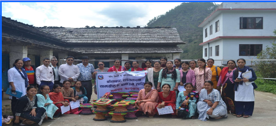
बाँसबाट आम्ची बनाउने तालिममा सहभागीहरू

त्यसैगरी महिला तथा बालबालिका शाखाबाट अपाङ्गता भएका व्यक्ति, जेष्ठ नागरिकहरूलाई १ सय ६४ वटा जेष्ठ नागरिक परिचय पत्र र अपाङ्गता सम्बन्धि परिचयपत्र वितरण र नविकरण गरिएको छ । त्यसैगरी क्षमता विकास कार्यक्रम अन्तर्गत २२ जना युवाहरूलाई २ लाख ११ हजार ९ सय बजेटमा बाँसबाट मुडा र फोटो फ्रेम बनाउने तालिम सञ्चालन सम्पन्न गरिएको छ ।